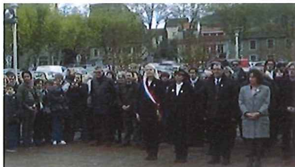
Commémoration du 11 novembre à Cahors