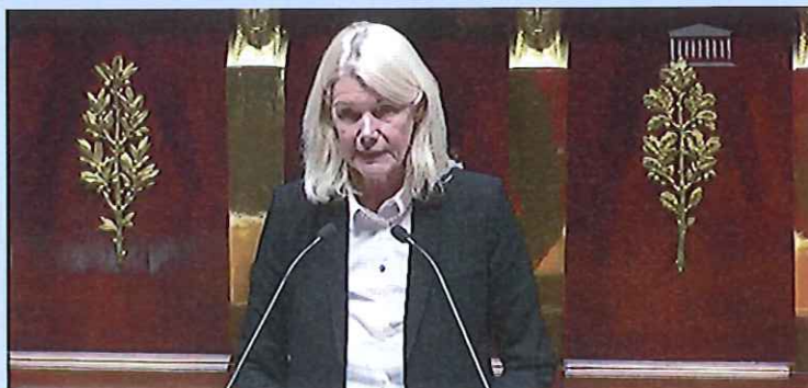
A la tribune dans l'Hémicycle lors de la lecture définitive sur le PLFSS 2017

La lecture définitive du projet de loi de financement de la sécurité sociale pour 2017 a eu lieu le lundi 5 décembre à l'Assemblée Nationale et a abouti sur son adoption. Lors de la dernière Newsletter j'avais déjà développé certains points afférents à ce texte mais je tiens à revenir sur certains d'entre eux.