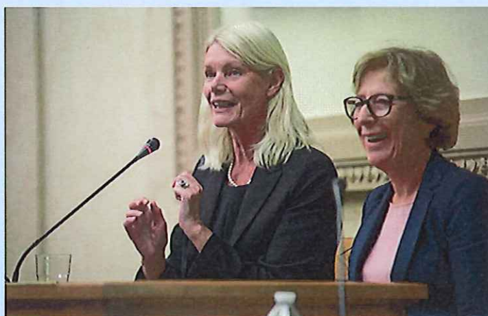
Conclusion du colloque avec Madame Geneviève Fioraso, ancienne Ministre de l'Enseignement supérieur et de la Recherche

A l'occasion de la sortie des actes du colloque portant sur les maladies rares qui a été organisée par Coopération Santé à l'Assemblée Nationale le 4 octobre dernier et que j'ai présidé, je tiens de nouveaux à remercier l'ensemble des intervenants et participants qui ont fait de cette réunion une réussite.