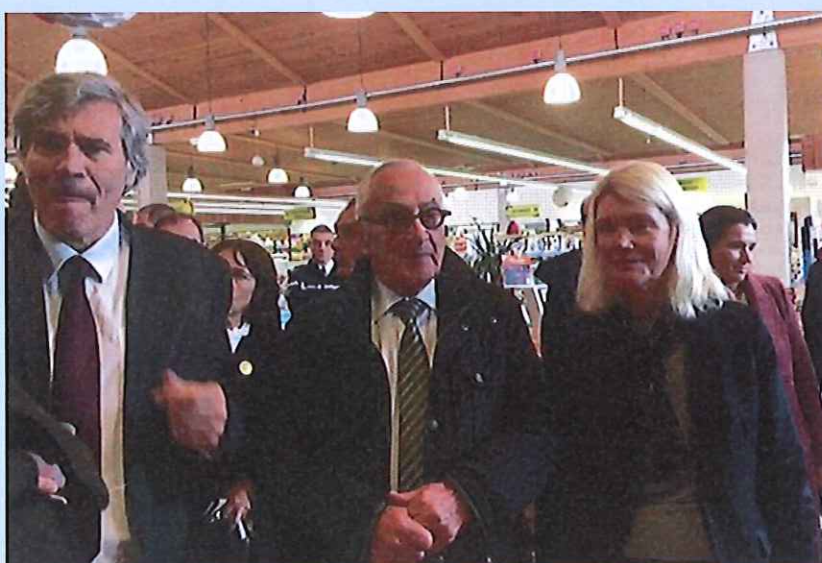
Echanges avec Monsieur le Ministre de l'Agriculture sur les problématiques agricoles lors de sa venue dans le Lot le 24/11/2016

Lors de la venue de Monsieur le Ministre dans le Lot le 24 novembre dernier, j'ai pu le solliciter sur cette réforme et le sensibiliser à nouveau sur ses impacts néfastes pour le monde agricole.