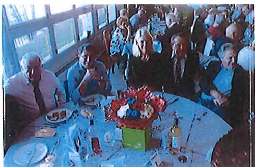
Repas annuel de la FNACA Cahors le 27 novembre 2016